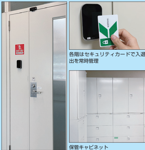
各階はセキュリティカードで入退出を常時管理